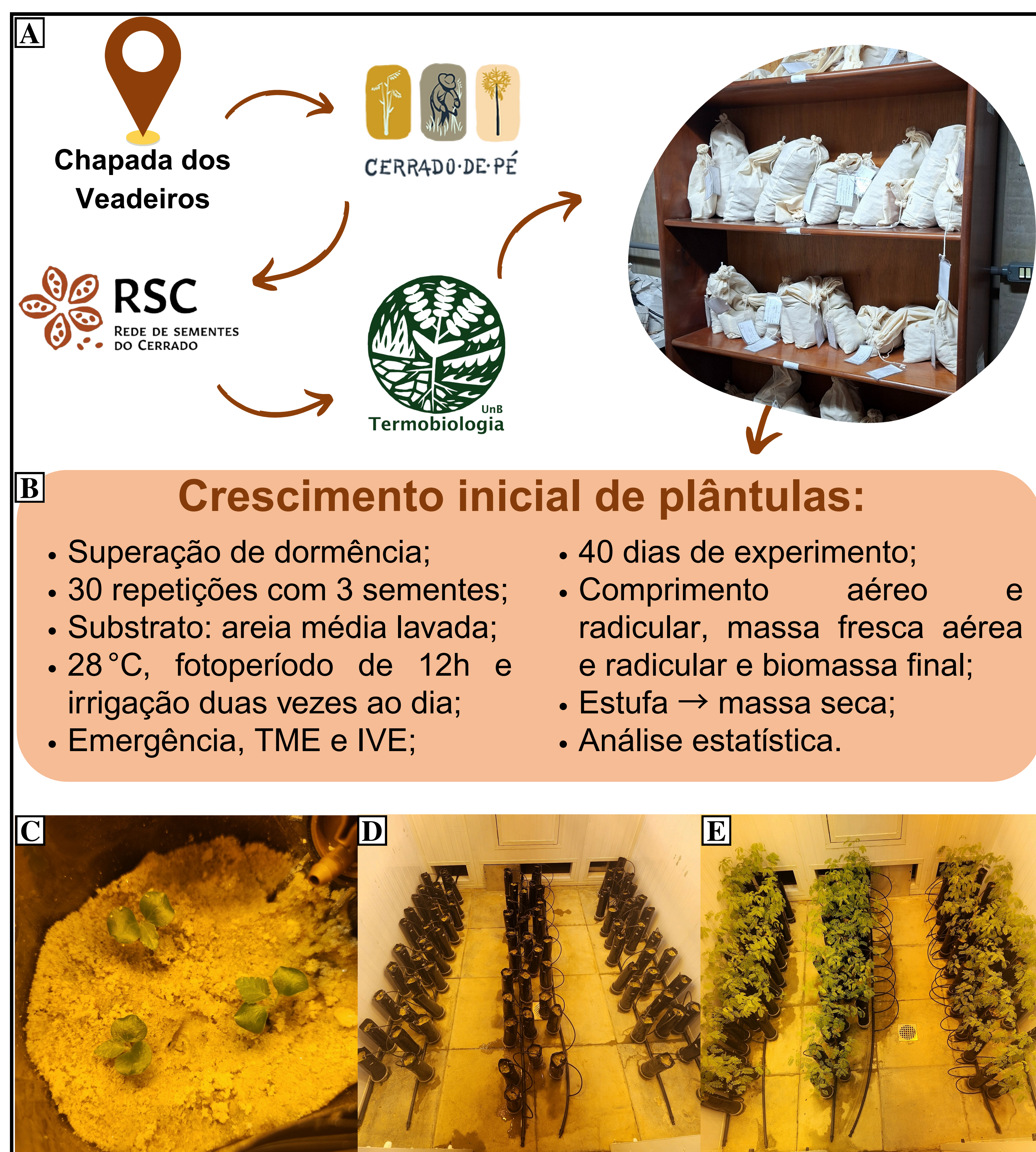
Figura 1. A: caminho da semente até Laboratório de Termobiologia da Universidade de Brasília; B: experimentos realizados (TME = tempo médio de emergência e IVE = índice de velocidade de emergência); C: plântulas de Guazuma ulmifolia com 14 dias da semeadura. D: experimento de Guazuma ulmifolia com 20 dias da semeadura. E: experimento de Enterolobium contortisiliquum com 20 dias da semeadura.